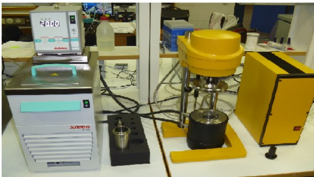
Рис. 1. Ротационный вискозиметр Rheotest-Medingen GmbH Rn4.1