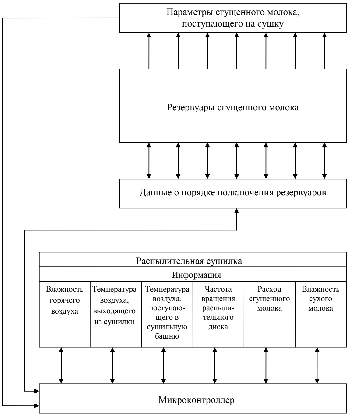
Рис. 2. Структурная схема стабилизации сухих молочных продуктов по влажности