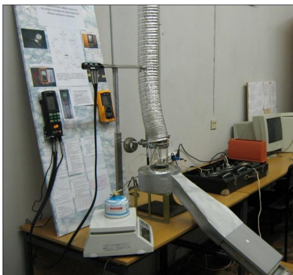
Рис.2. Лабораторная установка по определению эффективности тепловых аппаратов.

Воздух подавался через ресивер и реометр РДС к основанию факела. Электрод 4 подключен к высоковольтному трансформатору ТГ 220/2× 5000V. Второй электрод (горелка) заземлен. Фотография установки представлена на рис.2.